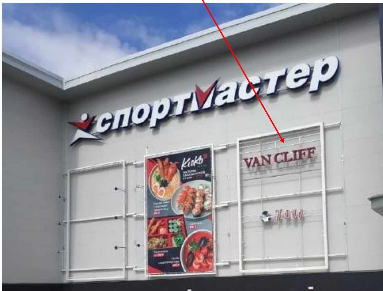
Фото рамы по факту с текущими арендаторами

ФОТО и примерные допустимые габариты привожу.